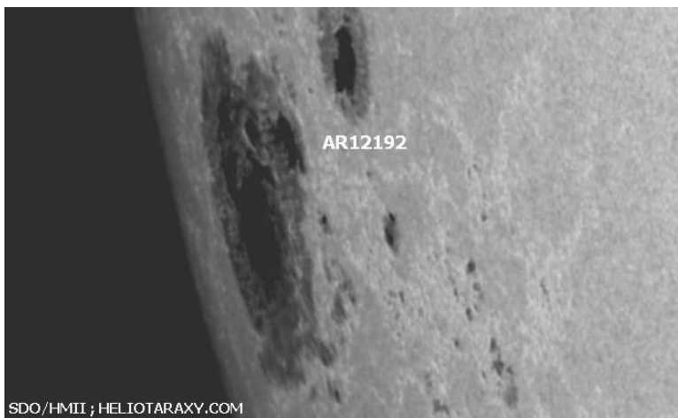
Групата петна 2192 на 18 октомври 2014г

Активността на групата петна 2192 през последната седмица беше голяма. Областта беше източник на три изригвания със средна и/или голяма мощност, които бяха регистрирани още докато тя беше откъм невидимата от Земята страна на Слънцето. По наше мнение първото от тях стана на 13 октомври , когато коронографът на сондата STEREO-A "улови" изхвърляне на коронална маса (CME) и следа от протонна (СЕЧ) ерупция. Най-вероятно събитието бе свързано със средно или мощно изригване именно от споменатата активна област