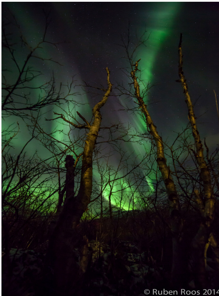
Сияние (Aurora Borealis) над Абиско (Швеция)

През последното денонощие имаше малка планетарна геомагнитна буря (Kp=5; бал G1) в периода между 18 и 21ч българско време. По същото време над България геомагнитната обстановка беше смутена (местният K- индекс в Панагюрище беше 4). Общо в продължение на още половин денонощие планетарната геомагнитна обстановка беше смутена. Над полярните райони на Земята имаше аврорална активност .