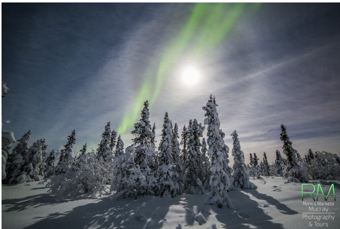
Северно полярно сияние (Aurora Borealis) в лунна нощ над Аляска

През последното денонощие геомагнитната обстановка беше активна и вчера рано следобяд достигна до ниво на планетарна геомагнитна буря (Kp=5; бал G1) между 14ч и 17ч българско време. Над България геомагнитната обстановка по същото време беше смутена. Над полярните райони на Земята имаше аврорална активност .