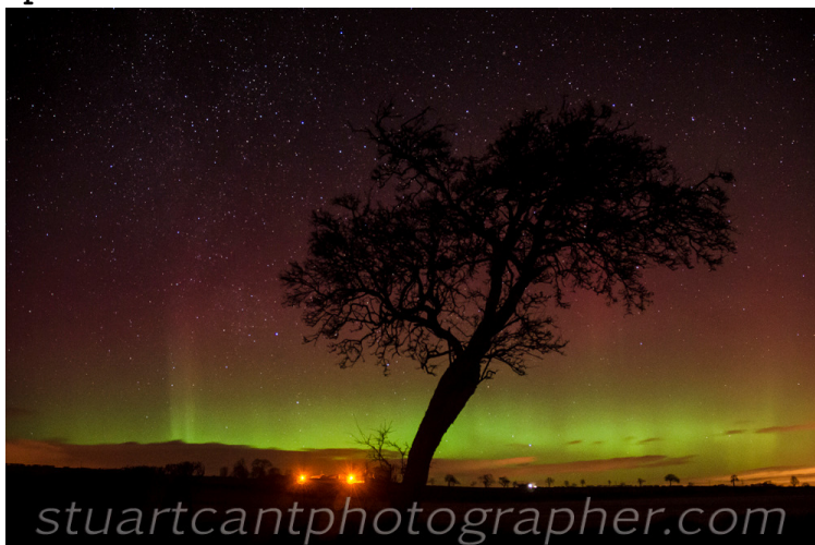
Сияние над Шотландия на 22 декември 2014г

През последното денонощие геомагнитната обстановка беше смутена в среднопланетарен мащаб. 3-часовият планетарен Kp-индекс беше равен на 4 тази нощ в интервала между 23ч и 5ч българско време. Над някои райони на Земята имаше местни магнитни бури. Над полярните райони има аврорална активност. Над България геомагнитната обстановка беше смутена. Местният 3-часов K- индекс в Панагюрише достигна смутени нива (бал 4) между 14ч и 17ч и след това между 23ч и 2ч българско време.