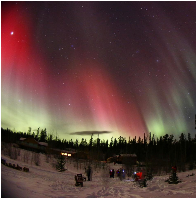
Северно сияние (Aurora Borealis) над провинция Юкон (Канада) на 17 март 2015г

Потокът на слънчевите протони с висока енергия ( E > 10 \text{ MeV} ; СЕЧ) на геостационарна орбита слезе до обичайния фон.