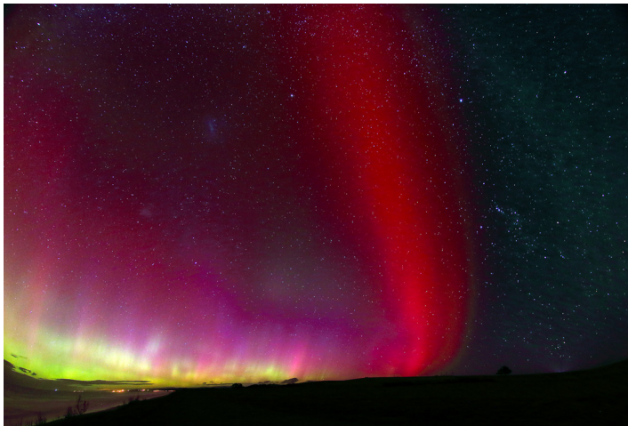
Южно сияние (Aurora Australis) над Оамару (Нова Зеландия) на 17 март 2015г