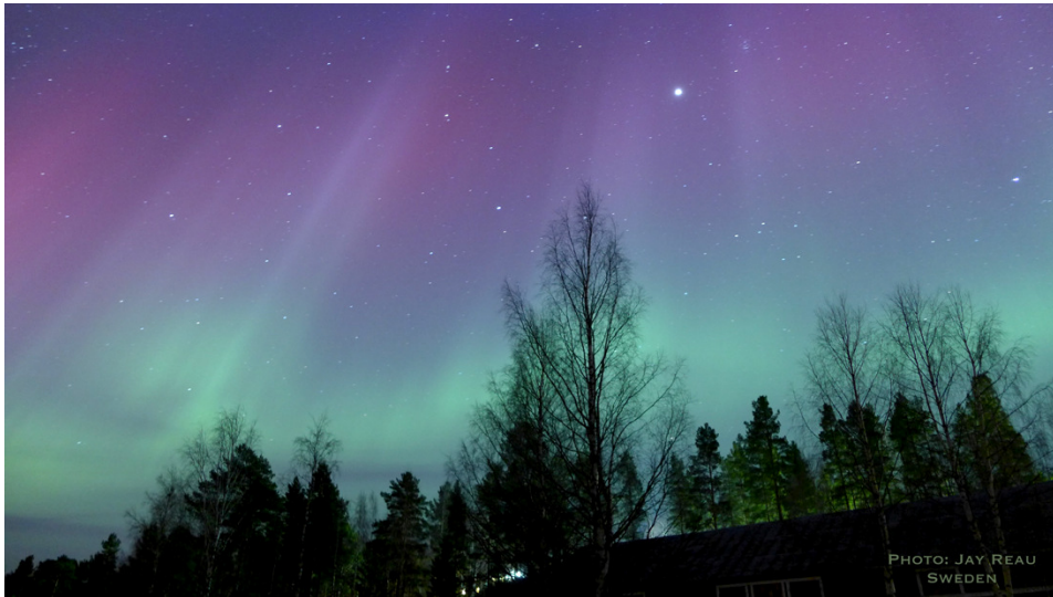
Северно сияние над Швеция (18 март 2015г)

Потокът на слънчевите протони с висока енергия ( E > 10 \text{ MeV} ; СЕЧ) на геостационарна орбита беше близо до обичайния фон.