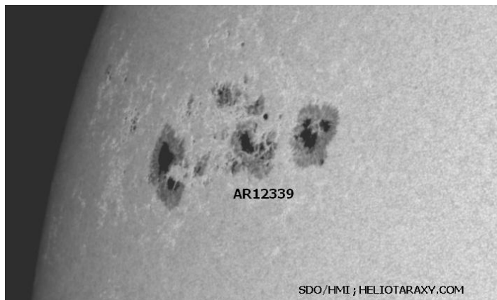
Областта AR12339 (2339) в бяла светлина на 7 май 2015г (SDO/HMI)

Вчера привечер между 17ч и 19ч българско време в южното полукълбо избухна протуберанс с протяжност от около 17 градуса. В момента се анализира дали изхвърленият облак слънчева коронална маса (CME) се движи към Земята.