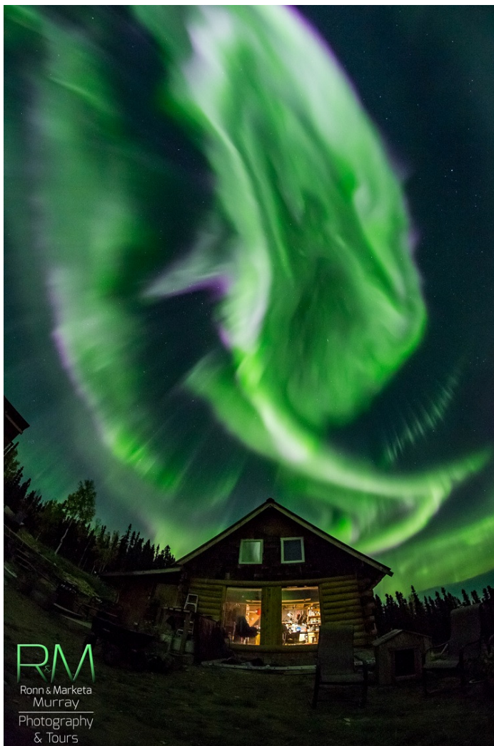
Полярно сияние над Аляска на 11 септември 2015г

Потокът на слънчевите протони с висока енергия ( E > 10\text{MeV} ; СЕЧ) на геостационарна орбита беше близо до обичайния фон.