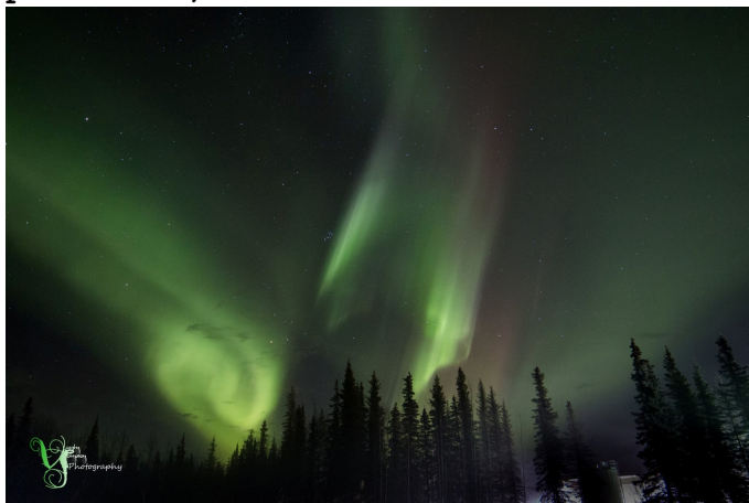
Северно полярно сияние (Aurora Borealis) над Аляска

През последното денонощие геомагнитната обстановка беше смутена. Снощи след 20ч българско време беше започна планетарна геомагнитна суббуря (Kp=4), която продължи през нощта и тази сутрин. Над полярните райони на Земята имаше аврорална активност. Над България геомагнитната обстановка беше смутена снощи между 23ч и 2ч българско време (местният K-индекс за станция Панагюрище в този интервал беше равен на 4).