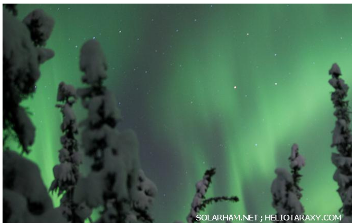
Северно сияние (Aurora Borealis) над гр. Фейрбанкс, Аляска на 7 декември 2015г

През последното денонощие геомагнитната обстановка беше активна, като вчера между 11ч и 14ч достигна до ниво на слаба планетарна геомагнитна буря ( K_p=5 ; G_1 ) (***!!!***) . Освен това общо в продължение на 18 от последните 24 часа K_p -индексът беше равен на 4 (планетарна суббуря). Над България геомагнитната обстановка беше смутена вчера между 11ч и 17ч. Над полярните райони на Земята е регистрирана аврорална активност .